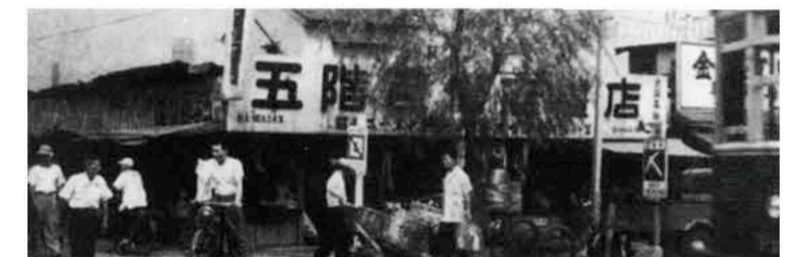
市電と五階百貨店