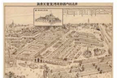
第五回国内勧業博覧会全景図